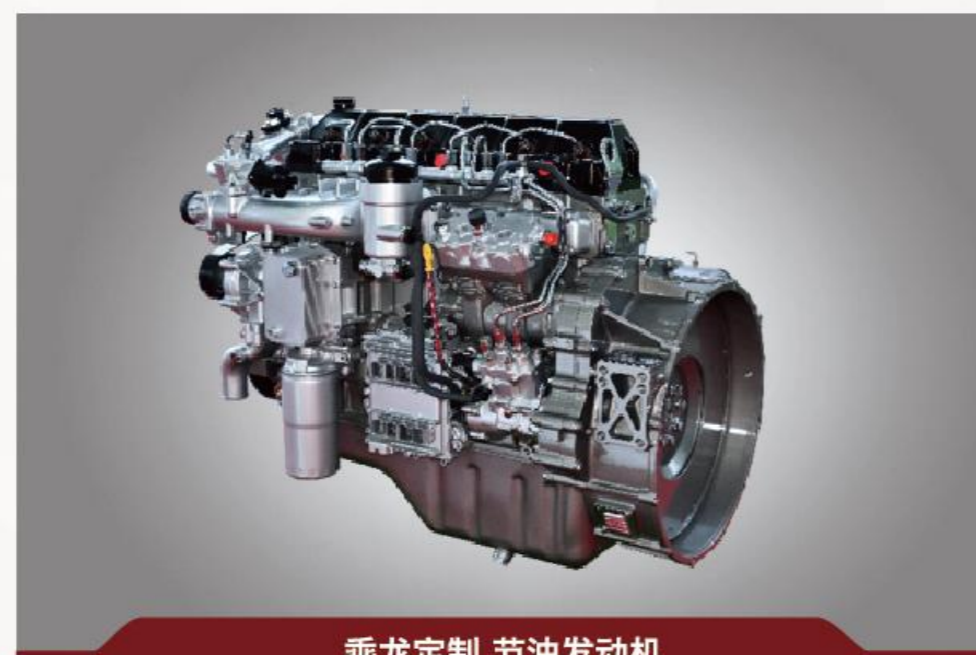
乘龙定制 节油发动机