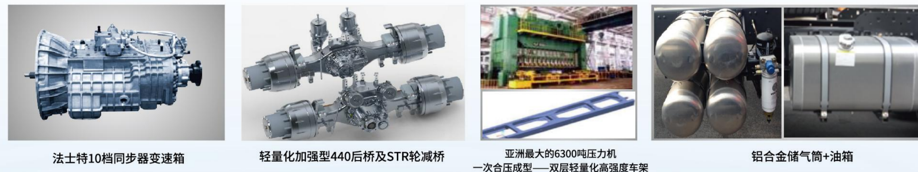
法士特10档同步器变速箱